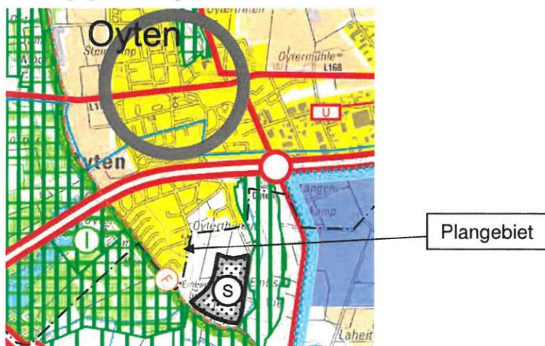
Abb.: Ausschnitt aus dem RROP 2016 des Landkreises Verden

Das Plangebiet und die nördlich und westlich angrenzenden Flächen werden als zentrales Siedlungsgebiet dargestellt.