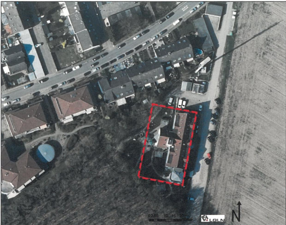
Abbildung 1: Übersicht Geltungsbereich

Die südlich bzw. westlich des Geltungsbereiches befindlichen Gehölze sind gemäß Landschaftsrahmenplan des Landkreis Verden 2008 als Biotoptypen mit mittlerer Bedeutung (Wertstufe III) dargestellt. Sie ragen kleinflächig in den äußersten Randbereichen in das Plangebiet hinein.