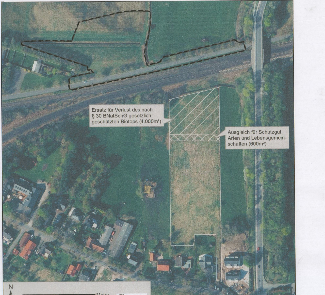
Abbildung 1: Teilbereich 2 und vorgesehener plangebietsexterner Ausgleich für das Schutzgut Arten und Biotop auf Flurstück 75/27 der Flur 45 in der Gemarkung Oyten

7. Ausgleichsflächen: Für das Schutzgut Arten und Biotop ist die Entsigelung eines Nassgrünlandes (seggen-, binsen- oder hochstaudenreichen Nasswiese, Zielbiotop gem. Drachenfels: GN) auf dem gemeindeeigenen Flurstück 75/27 der Flur 45 in der Gemarkung Oyten vorgesehen. Die Ausgleichsfläche hat eine Gesamtgröße von 14.610 m 2 . Davon sind ca. 4.000 m 2 als Ersatz für den Teilflächenverlust des gesetzlich geschützten Biotops vorgesehen (vgl. Nr. 6) sowie 600 m 2 als Ausgleich für das Schutzgut Arten und Biotop.