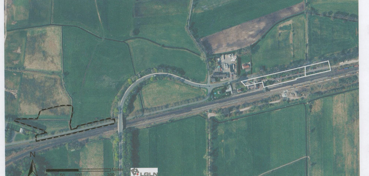
Abbildung 2: Lage der vorgesehenen Entsigelungsmaßnahme (Flurstück 127/15, Flur 45 der Gemarkung Oyten und Flurstück 82/3, Flur 4 der Gemarkung Oyten) östlich des Teilbereiches 2

Für das Schutzgut Boden ist die Entsigelung des vorhandenen Parkplatzes im Bereich des bestehenden Bahnhofs Sagehorn auf einer Teilfläche von insgesamt ca. 3.700 m 2 vorgesehen. Die vorhandene Parkplatzaufbaufläche soll aufgenommen und die entsiegelte Fläche der Sukzession überlassen werden. Die Maßnahme wird auf dem Flurstück 127/15, Flur 45 der Gemarkung Oyten sowie dem Flurstück 82/3 der Flur 4 der Gemarkung Oyten durchgeführt. Es handelt sich um gemeindeeigene Flurstücke.