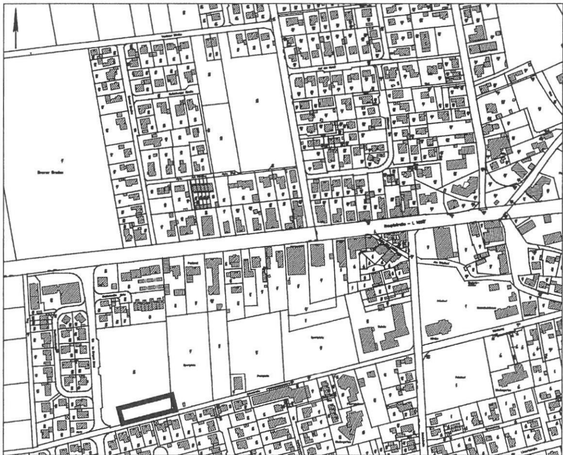
Abb. 1: Lage und räumlicher Geltungsbereich der Bebauungsplanänderung (ohne Maßstab)

Das Änderungsgebiet hat eine Größe von ca. 0,2 ha.