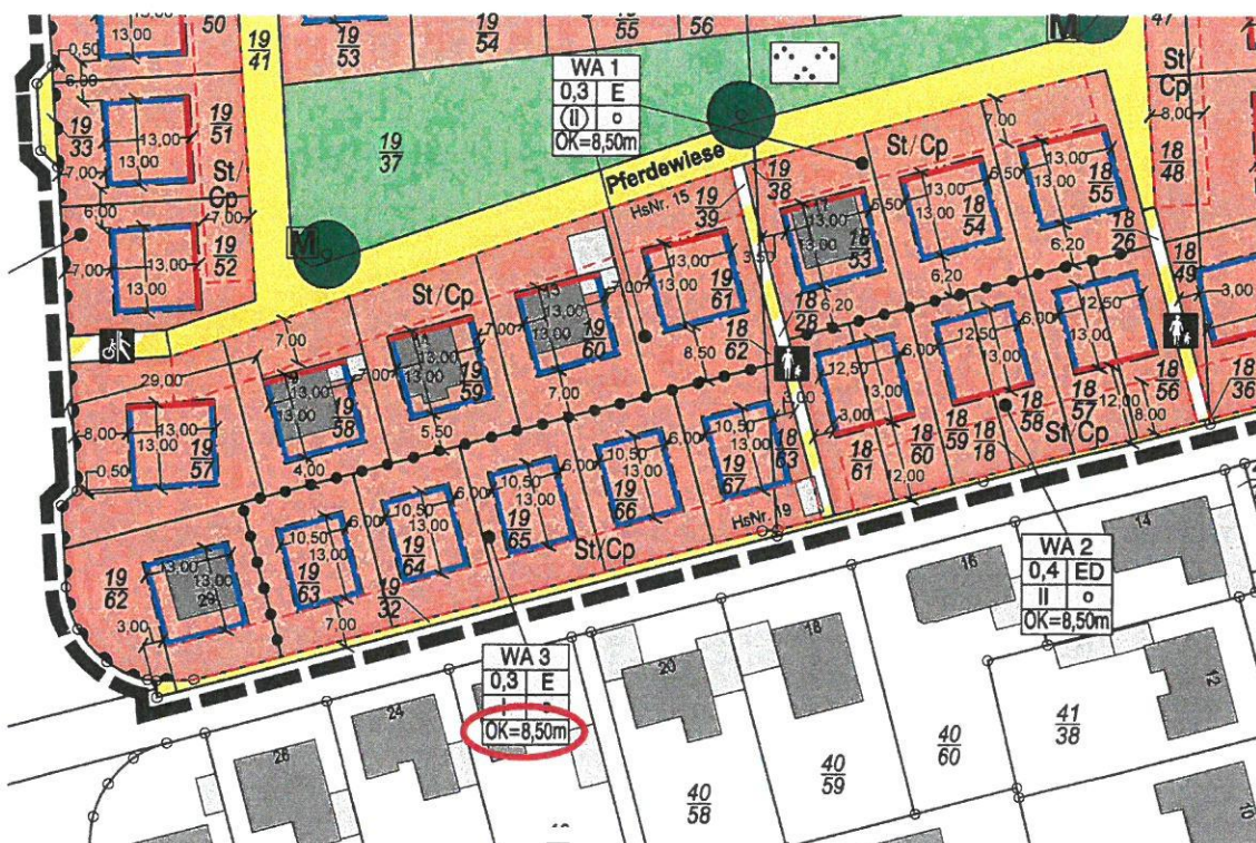
Abb. 2: Ausschnitt aus dem Bebauungsplan Nr. 98 „Alter Sportplatz“ mit örtlichen Bauvorschriften in der rechtsverbindlichen Fassung der 2. Änderung (ohne Maßstab)

Beim Übertragen der zeichnerischen Festsetzungen des Bebauungsplanes Nr. 98 wurde in dem Gebiet WA 3 versehentlich die zulässige Höhe der Gebäudeoberkante (OK) mit 8,50 m festgesetzt (siehe Abb. 2).