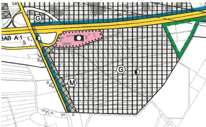
Abb.: Ausschnitt aus dem wirksamen Flächennutzungsplan der Gemeinde Oyten

Im rechtswirksamen Flächennutzungsplan der Gemeinde Oyten sind das Plangebiet und die angrenzenden Bereiche als gewerbliche Baufläche dargestellt.