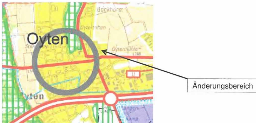
Abb.: Ausschnitt aus dem RROP des Landkreises Verden 2016

Im RROP 2016 wird die Gemeinde Oyten als Grundzentrum dargestellt. Für den Änderungsbereich wird ein zentrales Siedlungsgebiet dargestellt.