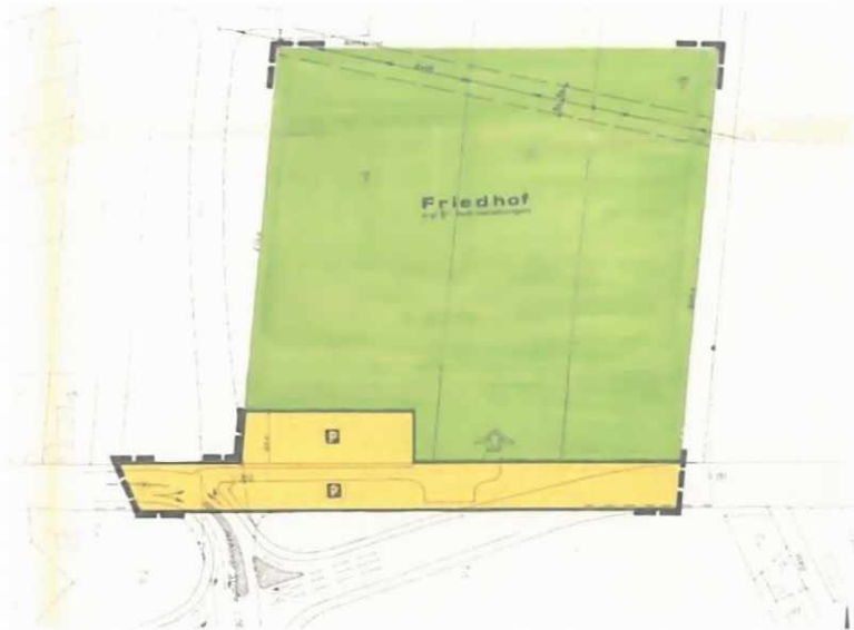
Abb.: Planteil des Bebauungsplanes Nr. 27 „Friedhof“

Für den Änderungsbereich liegt der rechtskräftige Bebauungsplan Nr. 27 „Friedhof“ aus dem Jahr 1978 vor. Der Bebauungsplan setzt für den südlichen Teil dieser 27. Änderung eine Straßenverkehrsfläche mit der Zweckbestimmung „öffentliche Parkierungsfläche“ fest. Die nördlichen Flächen diese 27. Änderung werden als Grünflächen „Friedhof“ ausgewiesen.