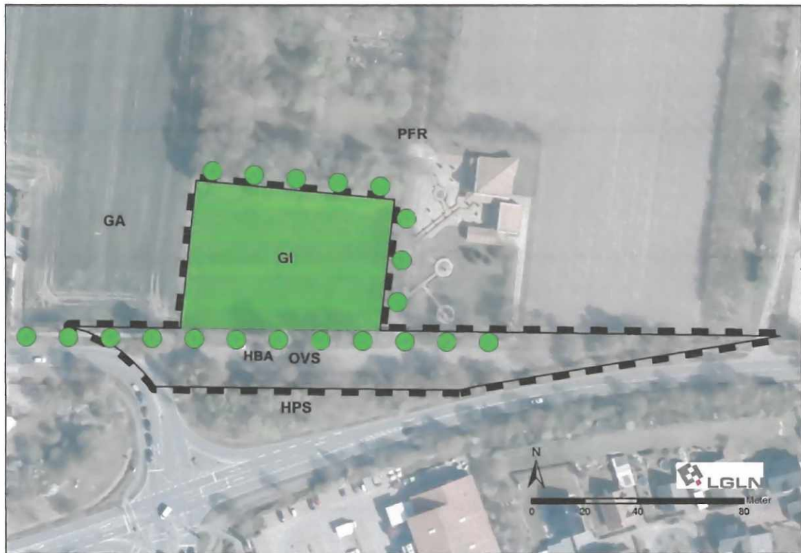
Abbildung 1: Geltungsbereich der Flächennutzungsplanänderung mit Biotoptypen

Der Gehölzbestand, der südlich des alten Verlaufs der L 168 angrenzt, wird im Entwicklungsplan Natur und Landschaft der Gemeinde Oyten 2002 (Karte 4b „Wichtige Bereiche Arten- und Lebensgemeinschaften“) als Biotop mit sehr hoher Bedeutung Wertstufe IV und V dargestellt.