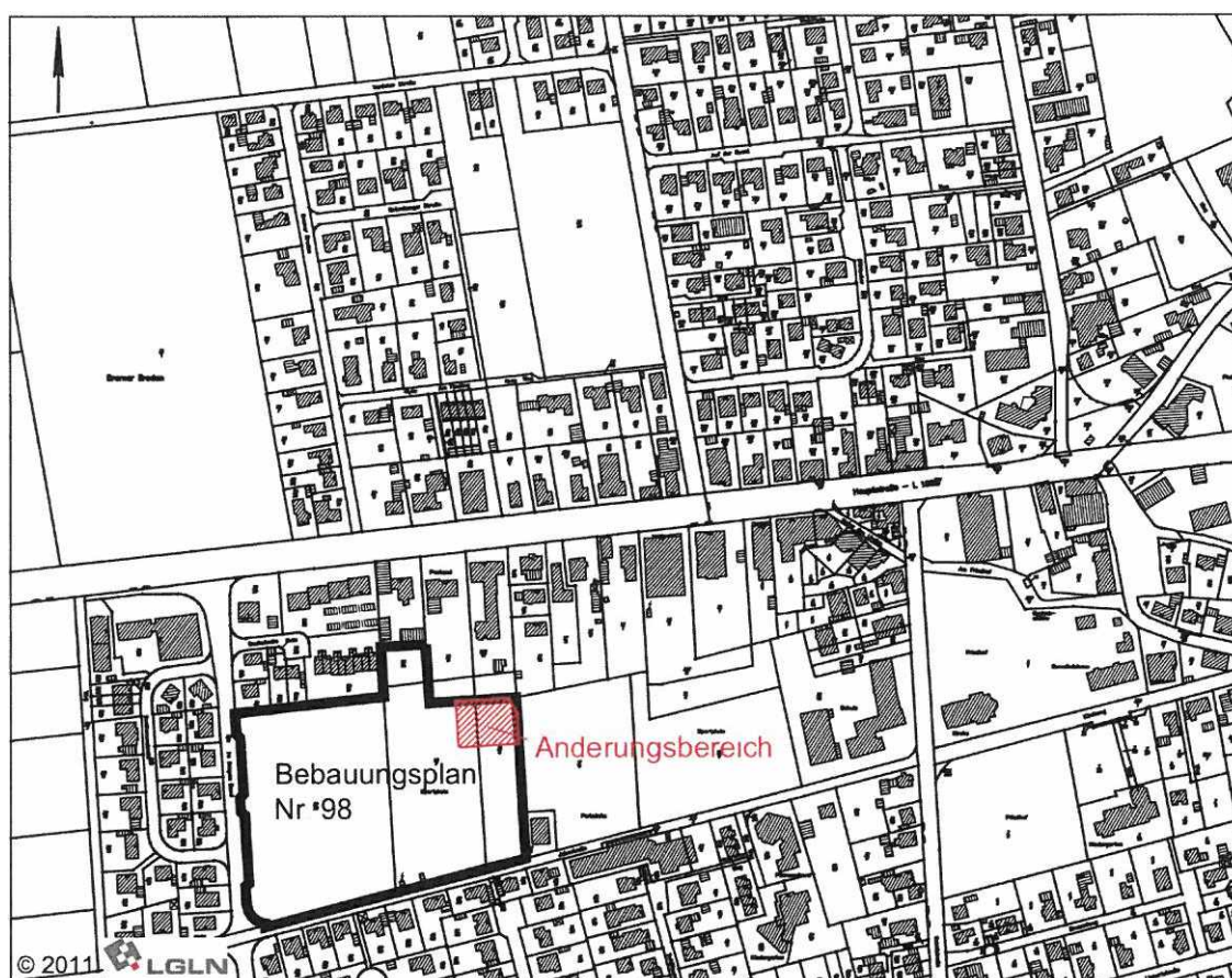
Abb 1 Lage und raumlicher Geltungsbereich des Bebauungsplanes Nr 98 und der 4. Bebauungsplanänderung (ohne Maßstab)

Die genaue Abgrenzung des Geltungsbereichs ergibt sich aus der Planzeichnung. Das Planänderungsgebiet hat eine Größe von ca. 0,14 ha.