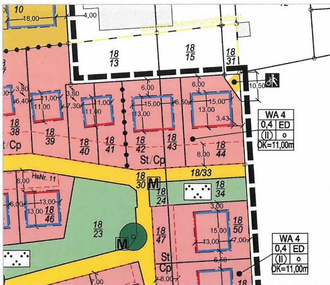
Abb. 1: Auszug aus dem Bebauungsplan Nr. 98 „Alter Sportplatz“ in der Fassung der 2. Änderung

Das Bauvorhaben liegt in dem nördlichen Teil des allgemeinen Wohngebietes WA 4 (siehe auch Auszug aus dem Bebauungsplan Nr. 98 in Abb. 2). Die Grundflächenzahl beträgt 0,4. Zulässig ist hier eine Bebauung mit Einzel- und Doppelhäusern mit zwingend zwei Vollgeschossen in offener Bauweise. Die Gebäudehöhe darf maximal 11,00 m über der Fahrhahnoberkante der Erschließungsstraße erreichen. In dem Planänderungsgebiet sind zwei überbaubare Grundstücksflächen à 15,00 m x 13,00 m durch eine vordere Baulinie sowie rückwärtige und seitliche Baugrenzen abgegrenzt, die in einem Abstand von jeweils 6,00 m zur nördlichen Grundstücksgrenze liegen. Entlang der südlichen Grundstücksgrenze sind Flächen für Stellplätze und Carports mit einer Tiefe von 8,00 m festgesetzt.