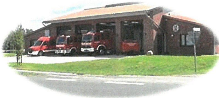
Freiwillige Feuerwehr Bassen

Gemeinde Oyten Fachbereich Bürgerservice Hauptstraße 55 28876 Oyten