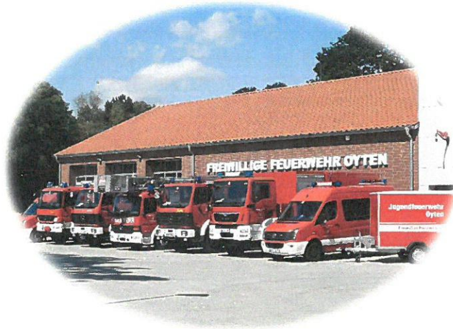
Freiwillige Feuerwehr Oyten