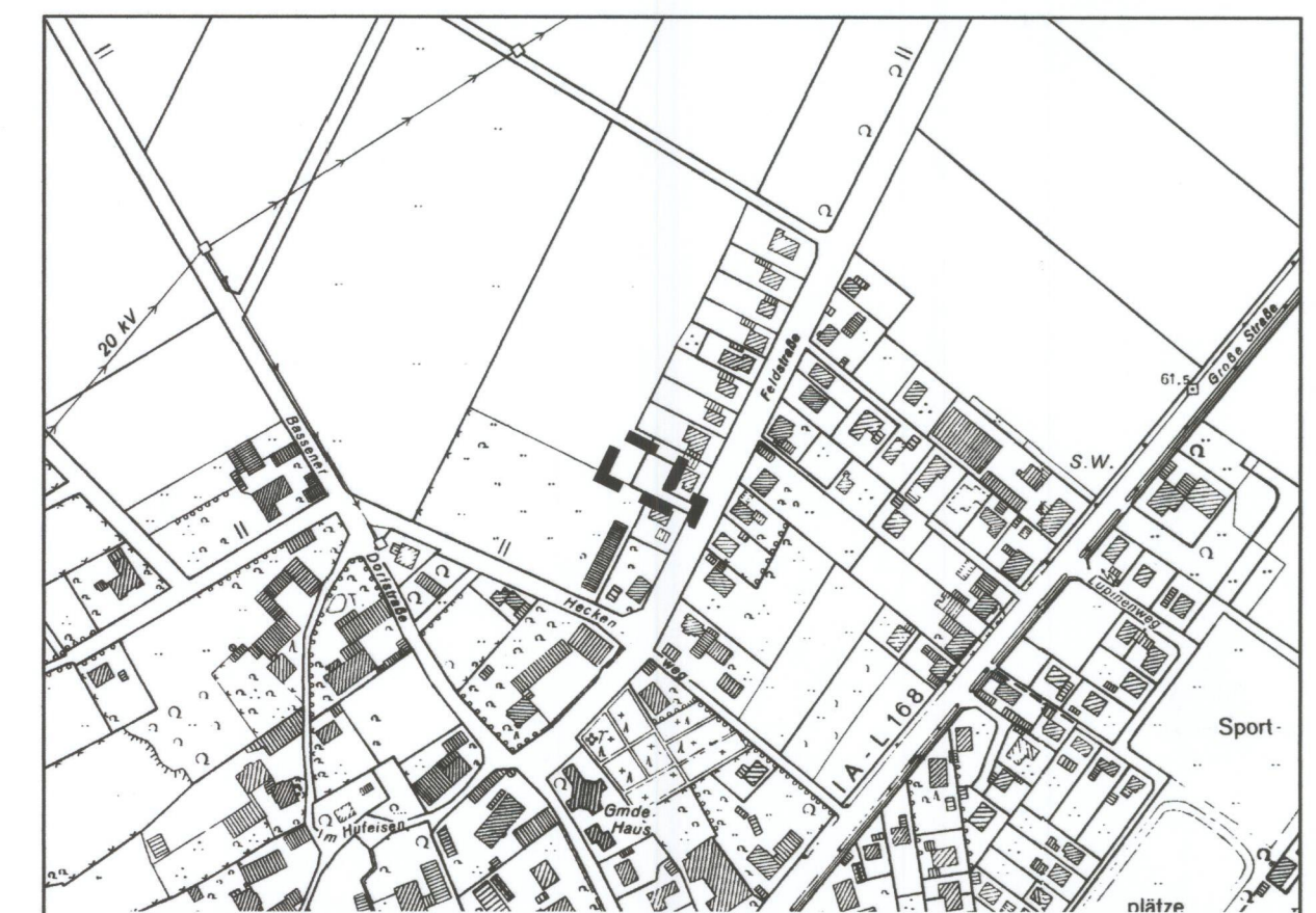
Übersichtsplan : 1 : 5000