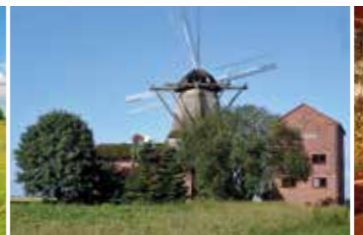
Imposant - die Windmühle in Kampen