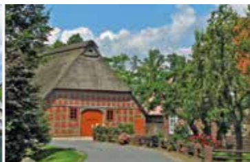
Typisch norddeutsch - die mit Reed gedeckten Fachwerkhäuser