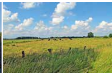
Weite Wümmelandschaft unter Wolkenhimmel