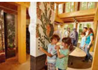
Der Natur auf der Spur im Heide-ErlebnisZentrum in Undeloh