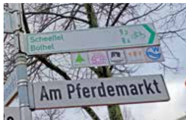
Hier geht es lang

Bremer Touristik-Zentrale GmbH Findorffstraße 105 28215 Bremen Tel.: 04261 3080010 btz@bremen-tourism.de www.bremen-tourismus.de