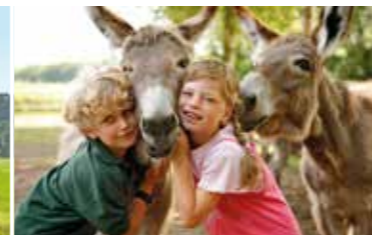
Tierisches Vergnügen im LandPark Lauenbrück