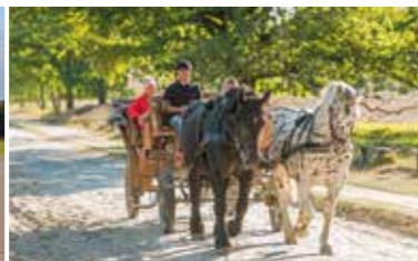
Kutschfahrt zwischen Undeloh und Wilsede