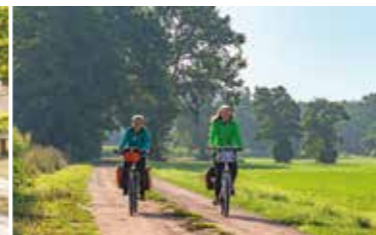
Entspanntes Fahren mitten durch die Feldmark