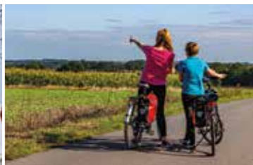
Auf nach Bremen