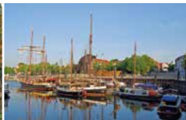
Entdecken des kleinen Vegesacker Museumshavens