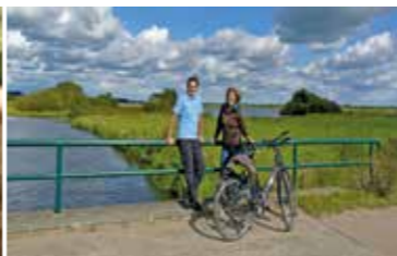
Kurze Rast an der Wümme