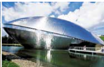
Ein Abstecher zum Bremer Universum